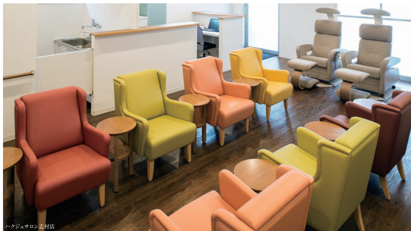
ハクジュサロン志村店