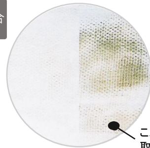
夢クリーンを使用した場合